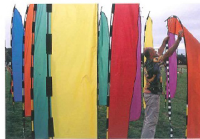
Festival des cerfs-volants