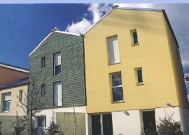
MÉLANGE DE COULEURS ET NOUVEAU PAYSAGE

Une fois franchi le Cher, le quartier des Deux-Lions nous invite au voyage. Surgi des prés et des mares, les cités, les immeubles, les ronds-points, les avenues ont envahi l'espace désertique, comme si on avait joué à une immense partie de Monopoly. Au bord de la rivière, quelques façades de bois nous font rêver du bord de mer ou du lointain Québec. Des plantes potagères, une poignée de fleurs de tournesols et de coquelicots émergent encore derrière les bordures de trottoirs toutes fraîches posées ; le vent d'ouest fait gîter la passerelle et, à deux pas, on entend cliqueter les bateaux du club de voile. Dans ce nouveau quartier de la ville, l'atmosphère donne l'impression d'être un pionnier, un défricheur sur cette toute récente extension de Tours. Une extension prometteuse et encore sujette à de nombreux projets.