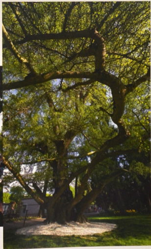
À gauche, la nouvelle serre ; au milieu, le jardin ; à droite, le célèbre ginkgo.