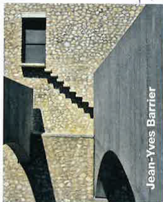
Andrew Ayers, éditions Axel Menges, en anglais et en français, 25 x 50 cm, 199 pages, 2009, 78 euros.